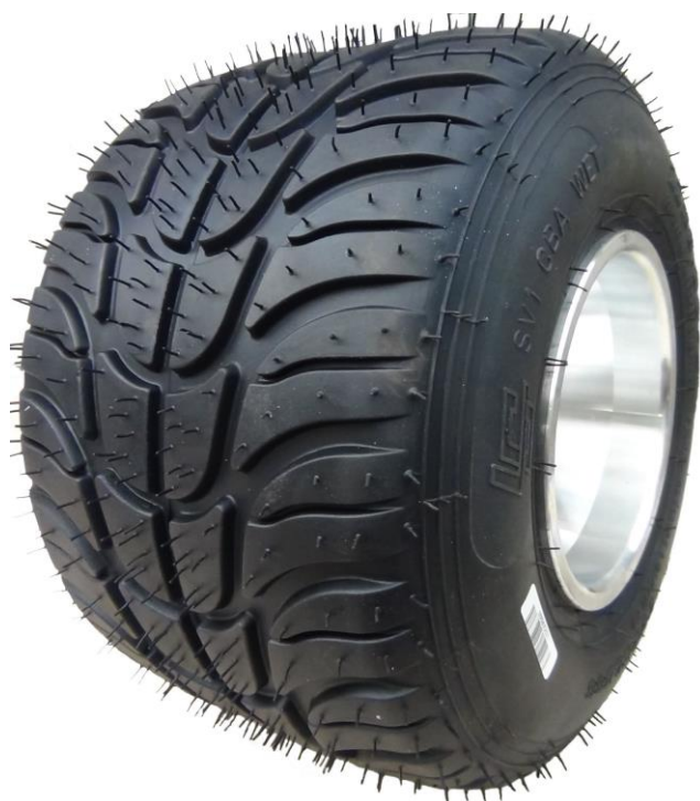
FOTO DO PNEU MONTADO NA RODA

Esta ficha de homologação reproduz descrições, ilustrações e dimensões do pneu no momento da homologação pela CBA. O fabricante do pneu pode modificá-lo, mas apenas dentro dos limites apresentados pelos regulamentos da CIK-FIA e da CBA em vigor. Somente a ficha de homologação poderá servir para identificar um produto homologado.