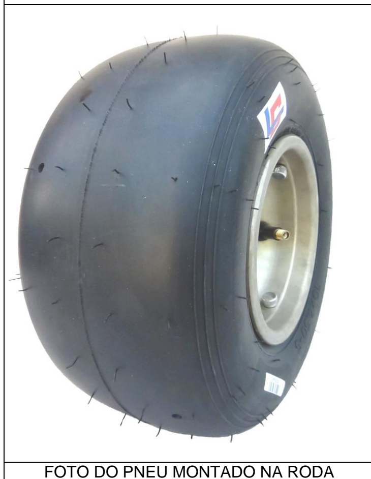
FOTO DO PNEU MONTADO NA RODA

Esta ficha de homologação reproduz descrições, ilustrações e dimensões do pneu no momento da homologação pela CBA. O fabricante do pneu pode modificá-lo, mas apenas dentro dos limites apresentados pelos regulamentos da CIK-FIA e da CBA em vigor. Somente a ficha de homologação poderá servir para identificar um produto homologado.