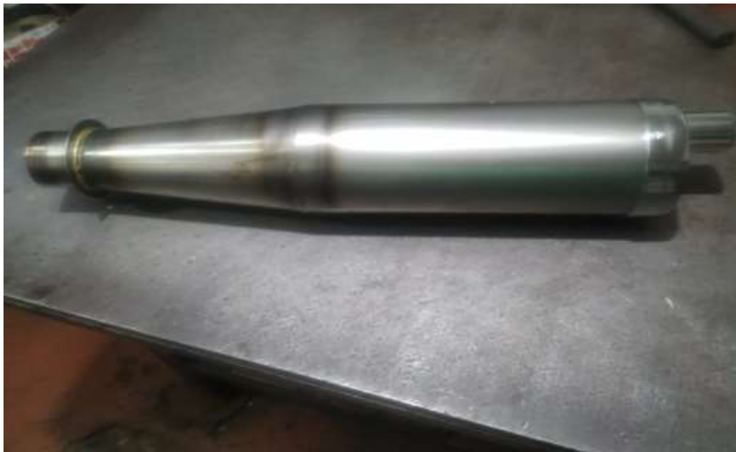
FOTO DO ESCAPAMENTO MOSTRANDO A MARCA ESTAMPADA

Essa ficha reproduz descrições, ilustrações e dimensões do escapamento no momento da homologação pela CBA. O fabricante poderá não modificá-la. Somente a ficha de homologação poderá servir para identificar um produto homologado.