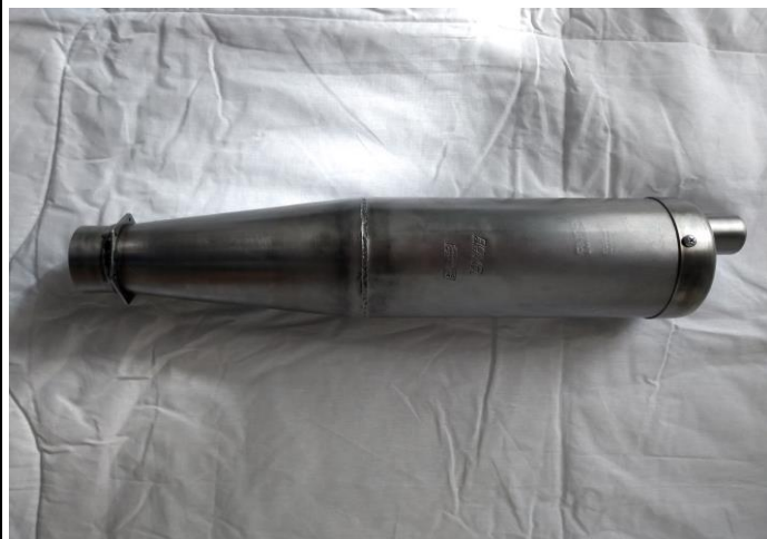
FOTO DO ESCAPAMENTO MOSTRANDO A MARCA ESTAMPADA

Essa ficha reproduz descrições, ilustrações e dimensões do escapamento no momento da homologação pela CBA. O fabricante poderá não modificá-la. Somente a ficha de homologação poderá servir para identificar um produto homologado.