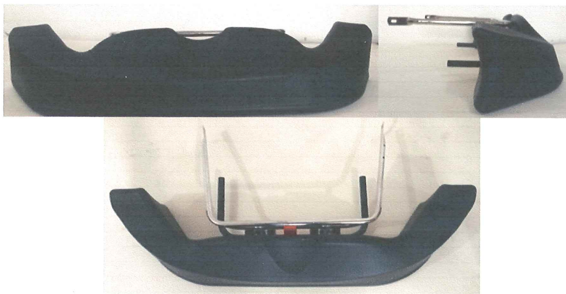
FOTO FRONTAL, SUPERIOR E LATERAL DO PAINEL DIANTEIRO (BICO) COM SUPORTES E FIXAÇÕES.

Essa ficha reproduz descrições, ilustrações e dimensões do painel dianteiro no momento da homologação pelo CNK/CBA. O fabricante poderá modificá-las, mas somente dentro dos limites fixados pelos regulamentos FIA Karting e da CNK/CBA em vigor. Somente a Ficha de Homologação poderá servir para identificar um produto homologado.