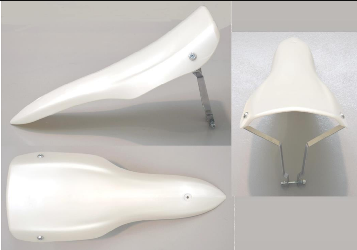
FOTO FRONTAL, SUPERIOR E LATERAL DO PAINEL SUPERIOR DIANTEIRO (GRAVATA) COM SUPORTES E FIXAÇÕES.

Essa ficha reproduz descrições, ilustrações e dimensões do painel superior dianteiro (gravata) no momento da homologação pelo CNK/CBA. O fabricante poderá modificá-las, mas somente dentro dos limites fixados pelos regulamentos FIA Karting e da CNK/CBA em vigor. Somente a Ficha de Homologação poderá servir para identificar um produto homologado.