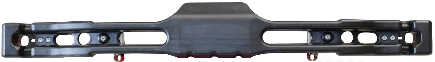
Photo vue arrière de la protection avec supports / Photo of the rear of the protection with supports

Signature et tampon de l'ASN / Signature and stamp of the ASN