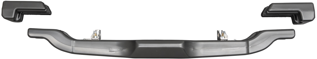
Photo vue de côté avec supports / Photo from the side with supports