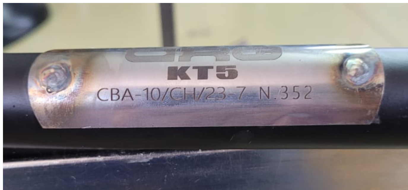
(C) FOTO DO NÚMERO DE HOMOLOGAÇÃO GRAVADO

A marcação deverá estar permanentemente visível, e não ser removida sob qualquer circunstância.