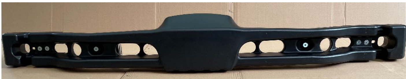
Photo vue arrière de la protection avec supports / Photo of the rear of the protection with supports

Signature et tampon de l'ASN / Signature and stamp of the ASN