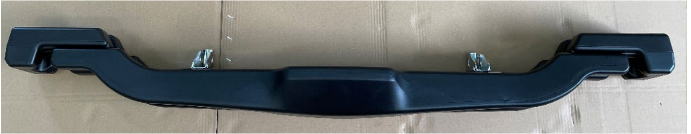
Photos vue de côté avec supports / Photos from the side with supports