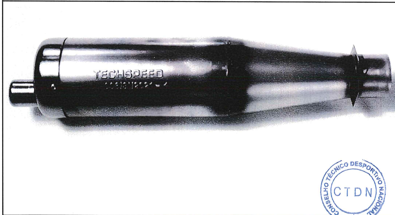
FOTO DO ESCAPAMENTO MOSTRANDO A MARCA ESTAMPADA

Essa ficha reproduz descrições, ilustrações e dimensões do escapamento no momento da homologação pela CBA. O fabricante poderá não modificá-la. Somente a ficha de homologação poderá servir para identificar um produto homologado.