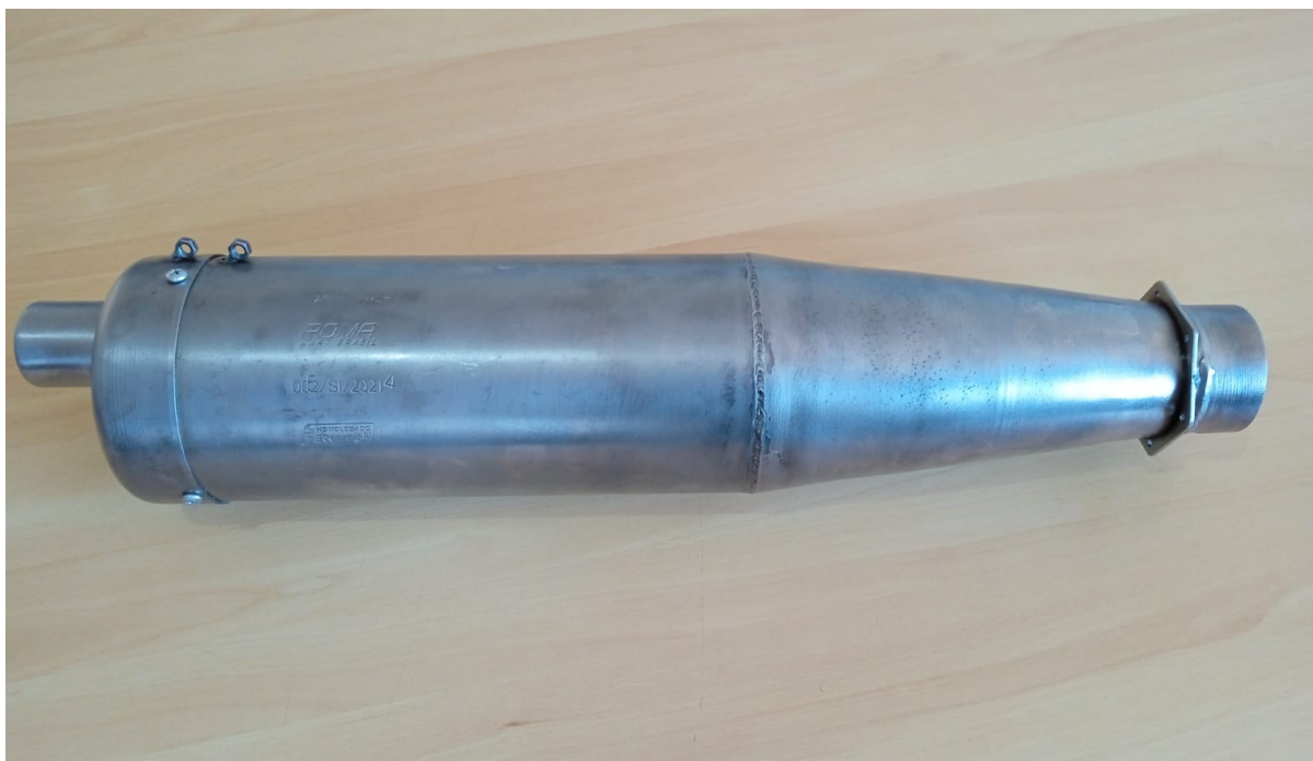
FOTO DO ESCAPAMENTO MOSTRANDO A MARCA ESTAMPADA

Essa ficha reproduz descrições, ilustração e dimensões da embreagem no momento de homologação p/ CBA. O fabricante não poderá modificá-la. Somente a ficha de homologação poderá servir para identificar um produto homologado.