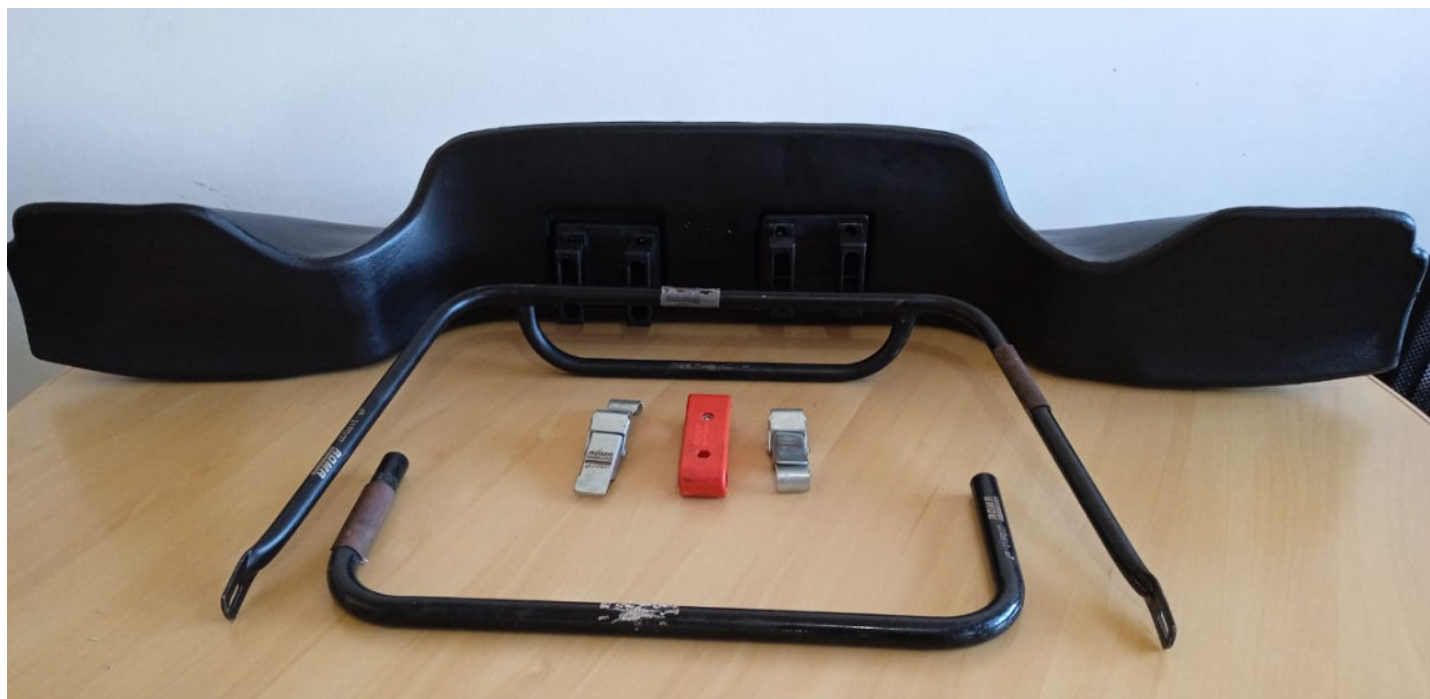
FOTO DAS MARCAÇÕES DOS NÚMEROS DE HOMOLOGAÇÃO EM TODAS AS PEÇAS (e do logo da CNK/CBA (nas peças de plástico))

As marcações deverão estar permanentemente visíveis, e não serem removidas sob qualquer circunstância.