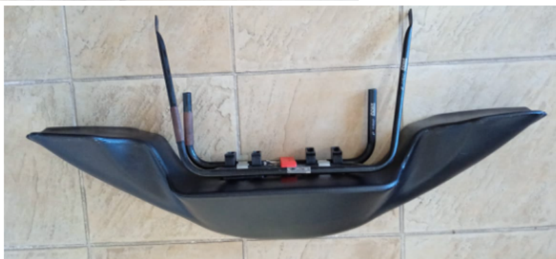
FOTO FRONTAL, SUPERIOR E LATERAL DO PAINEL DIANTEIRO (BICO) COM SUPORTES E FIXAÇÕES.

Essa ficha reproduz descrições, ilustrações e dimensões do painel dianteiro no momento da homologação pelo CNK/CBA. O fabricante poderá modificá-las, mas somente dentro dos limites fixados pelos regulamentos FIA Karting e da CNK/CBA em vigor. Somente a Ficha de Homologação poderá servir para identificar um produto homologado.