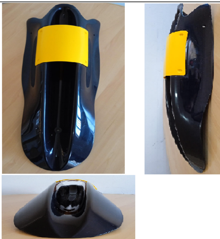
FOTO FRONTAL, SUPERIOR E LATERAL DO PAINEL SUPERIOR DIANTEIRO (GRAVATA) COM SUPORTES E FIXAÇÕES.

Essa ficha reproduz descrições, ilustrações e dimensões do painel superior dianteiro (gravata) no momento da homologação pelo CNK/CBA. O fabricante poderá modificá-las, mas somente dentro dos limites fixados pelos regulamentos FIA Karting e da CNK/CBA em vigor. Somente a Ficha de Homologação poderá servir para identificar um produto homologado.