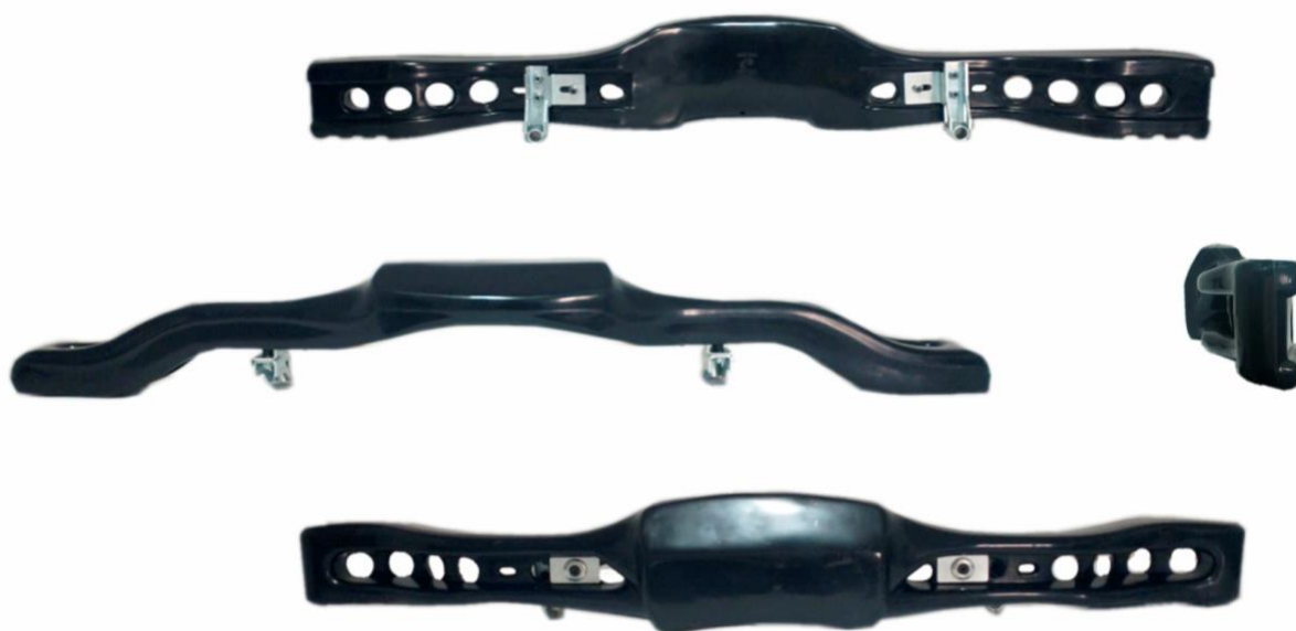
FOTO FRONTAL, SUPERIOR E LATERAL DO PÁRA-CHOQUES TRASEIRO COM SUPORTES E FIXAÇÕES.

Essa ficha reproduz descrições, ilustrações e dimensões do pára-choques traseiro no momento da homologação pelo CNK/CBA. O fabricante poderá modificá-las, mas somente dentro dos limites fixados pelos regulamentos FIA Karting e da CNK/CBA em vigor. Somente a Ficha de Homologação poderá servir para identificar um produto homologado.