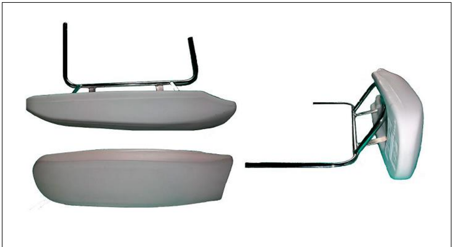
FOTO FRONTAL, SUPERIOR E LATERAL DAS CARENAGENS LATERAIS COM SUPORTES E FIXAÇÕES.

Essa ficha reproduz descrições, ilustrações e dimensões das carenagens laterais no momento da homologação pelo CNK/CBA. O fabricante poderá modificá-las, mas somente dentro dos limites fixados pelos regulamentos FIA Karting e da CNK/CBA em vigor. Somente a Ficha de Homologação poderá servir para identificar um produto homologado.