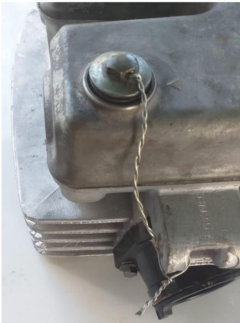
Imagem 2 – Detalhe furo passante no parafuso do cabeçote

4.3 - COMANDO DE VÁLVULAS - Original do modelo ou paralelo desde que tenha as mesmas características e medidas dos originais.