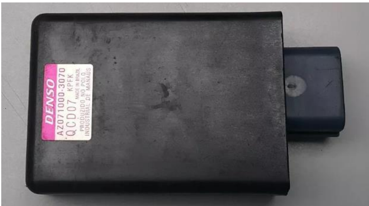
Imagem 6 – Identificação da CDI na cor obrigatória.