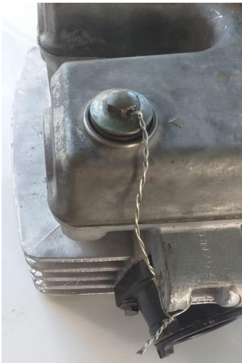
Imagem 2 – Detalhe furo passante no parafuso do cabeçote

4.3 - COMANDO DE VÁLVULAS - Original do modelo ou paralelo desde que tenha as mesmas características e medidas dos originais. Permitido sacar as engrenagens e alterar o ponto.